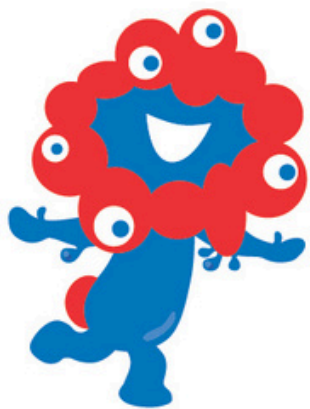
公式キャラクター ミヤクミヤク