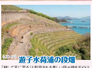
遊子水荷浦の段畑 「耕して天に至る」と形容される美しい段々畑をガイドと一緒に観光します。雄大な景色は、国の重要な文化的景観や日本農村百景に選定されているほどで、下から見上げると、まるで天上に階段のように見えます。