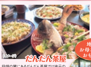
だんだん茶屋 段畑の麓にあるだんだん茶屋では地元のお母さん達が手料理と朝獲れの絶品鯛をおもてなしてくれます。バイキング形式で旬な宇和島の味をお楽しみください。