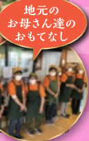
地元の お母さん達の おもてなし