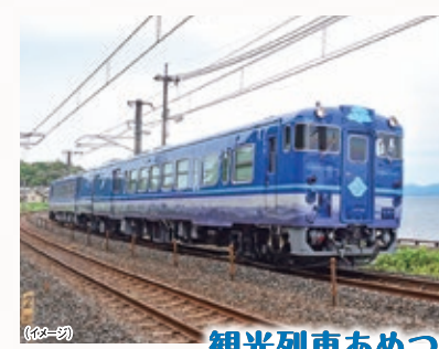
観光列車あめつち

「ネイティブ・ジャパニーズ」というコンセプトのもとデザインされた車両は、車体全体に山陰の海と空をイメージした紺藍色を使用し、車体下部の「銀色」の帯模様で、山陰の美しい山並みと、たたら製鉄にちなんだ日本刀の刃文を表現しています。地元工芸品が随所にあしらわれた車内から、山陰の美しい自然をお楽しみいただけます。