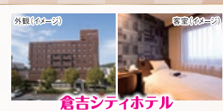
倉吉シティホテル

「ネイティブ・ジャパニーズ」というコンセプトのもとデザインされた車両は、車体全体に山陰の海と空をイメージした紺藍色を使用し、車体下部の「銀色」の帯模様で、山陰の美しい山並みと、たたら製鉄にちなんだ日本刀の刃文を表現しています。地元工芸品が随所にあしらわれた車内から、山陰の美しい自然をお楽しみいただけます。