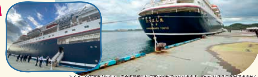
※イメージ写真となります。安全を最優先にご案内させていただきます。船内には入ることができません。