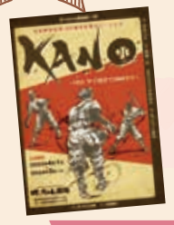
母恋夢のお土産付き!