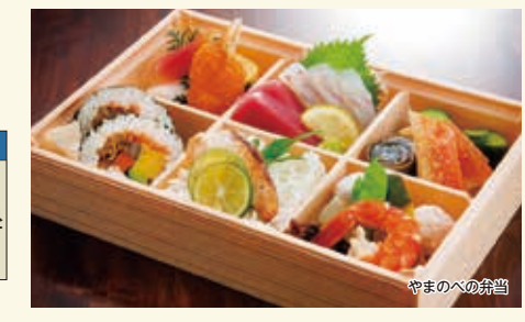
やまのべのお弁当