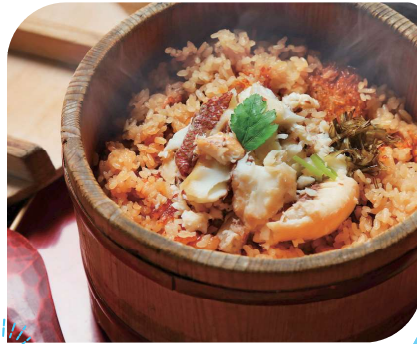
鯛めし 地元グルメを堪能!