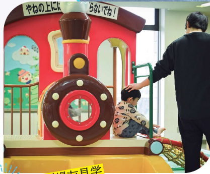
子どもの遊び場を見学