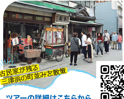
古民家が残る 三津浜の町並みを散策