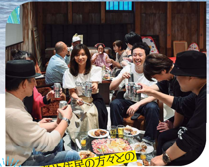
先輩移住者や住民の方々との 交流会