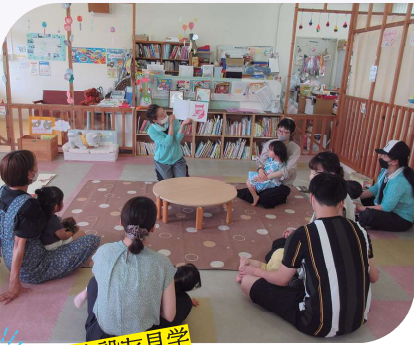
子育て支援施設を見学