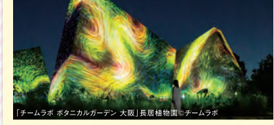
チームラボ ポタニカルガーデン 大阪 (イメージ)

道頓堀 大阪観光はグルメを楽しむの一つ!道頓堀ではたこ焼きやお好み焼きなど様々なグルメを楽しめます。