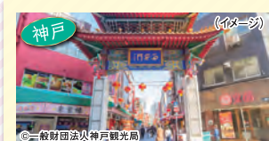
中華街南京町 (イメージ)