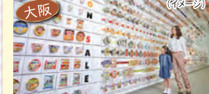
カップヌードルミュージアム大阪池田 (イメージ)

アトア átoa アクアリウムとアートが融合した新感覚の劇場型アクアリウム。光、音、映像、香りなどの演出によって、まったく異なる世界観を楽しめます。