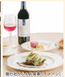
偕行社かふえお食事(イメージ)