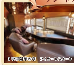
3号車グリーン個室 フィオーレシート

3号車グリーン個室 (フィオーレシート) に変更 お一人様追加 2,500円 (税込) ※2席からの販売となります。 貸切ではございません。