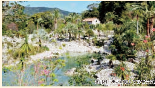
北川村「モネの庭」マルモッタン