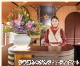
伊予灘ものがたり/アテンダント