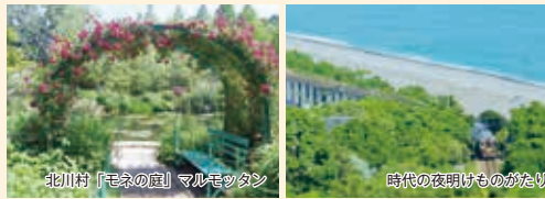
時代の夜明けものがたり