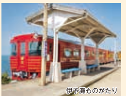
伊予灘ものがたり