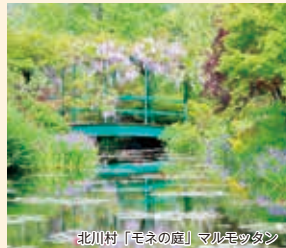
北川村「モネの庭」マルモッタン