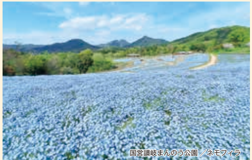
国営讃岐まんのう公園 / ネモフィラ