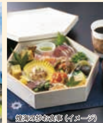
煌海の抄お食事(イメージ)