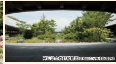
高知県立牧野植物園 高知県立牧野植物園理髪