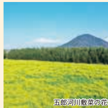
五郎河川敷菜の花