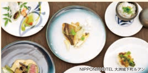
NIPPONIAHOTEL 大洲城下町ルアン