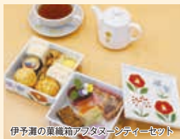
伊予灘の菓織箱アフタヌーンティーセット