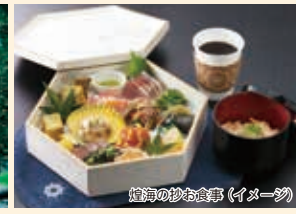
煌海の抄お食事(イメージ)