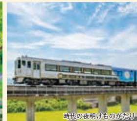
時代の夜明けものがたり