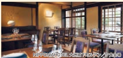
NIPPONIAHOTEL 大洲城下町ルアン/夕食会場