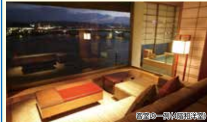
客室の一例(4階和洋室)

明治21年創業の老舗旅館。宍道湖を借景とした庭園をお楽しみ下さい。皆実家伝料理「鯛めし」の朝食も好評。