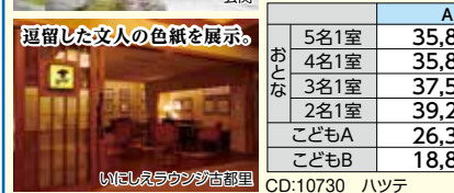
Wi-Fiエリアラウンジ吉野里