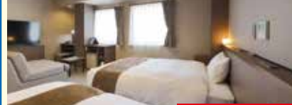
2号館ツイン 2019年12月リニューアル

JR松江駅北口すぐの好立地。無料レンタサイクルあります。チェックイン前、チェックアウト後の荷物預かり無料。