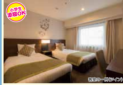
客室の一例(ツイン)

2015年に松江エクセルホテル東急としてリニューアルオープン、全室禁煙のホテルになります。