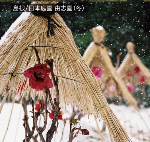
島根/日本庭園 由志園(冬)