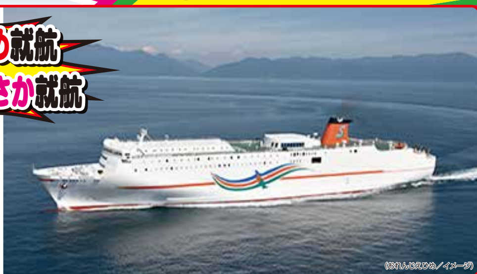
(おれんじえひめ/イメージ)

●当日(22:00発)の東予港行きにご乗船のお客様に限り船内の案内所でお荷物をお預かりいたします。(無料)