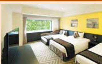
スタンダードフロアシティツインルーム(イメージ)

4～7階に位置する、広さ30～34㎡ のお部屋です。2～3名様でご利用 いただいてほしい広さの客 室は、お子さま連れでも楽々、快 適なホテルステイを満喫いた だけます。