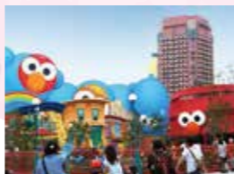
「ユニバーサルワンダーランド」から見たホテル近鉄ユニバーサルシティ(イメージ)

ホテルを出ればすぐゲート!ユニバーサル・スタジオ・ジャパンまで徒歩すぐの便利なホテル。