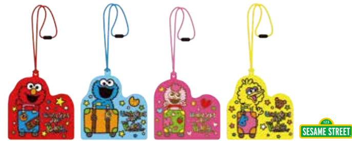
オリジナル・バスケース

ユニバーサル・スタジオ・ジャパンとホテル近鉄ユニバーサル・シティの コラボグッズをプレゼント! パークの人気者セサミストリート™のオリジ ナル・バスケースは、スタジオ・バスを入れたり、パークでも大活躍。 ※2019年4月1日～2020年3月31日ご宿泊まで ※1泊の滞在につき、お1人さま1つ限り(添い寝のお子さまは除く) ※種類(デザイン)は選べません ※画像はイメージです