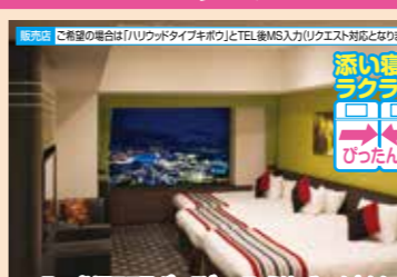
スーペリアフロアパークビューファミリールーム(イメージ)

8～25階に位置する、広さ40～ 45.5㎡のお部屋です。4名様でも 広々お使いいただけるゆりのス ペース。お土産が沢山増えても大 丈夫!目の前に広がるパーク内の景 色を眺めながら、楽しいひと時を お楽しみください。