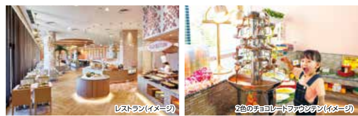
レストラン(イメージ)

ハワイアンキルトをモチーフにした、ピンクとホワイトの明るく華やかな空間。中央のオー ブ・キッチンでシェフが腕を振るう、出来立てのお料理をブッフェ・スタイルで存分にお 楽しみいただけます。 朝食営業時間/7:00～10:00(最終入店9:30)