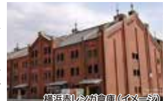
横浜赤レンガ倉庫(イメージ)

■利用可能路線/市営バス 全路線及び観光スポット周 遊バス「あかいくつ」、「ぶら り観光SAN路線」※チケット は横浜駅・新横浜駅などで 引き換えとなります。