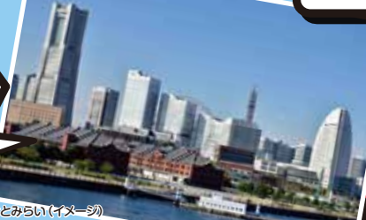
横浜みなとみらい(イメージ)