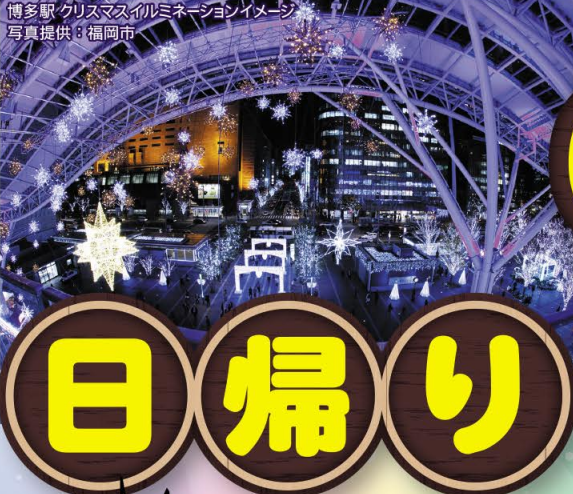
博多駅クリスマスイルミネーションイメージ