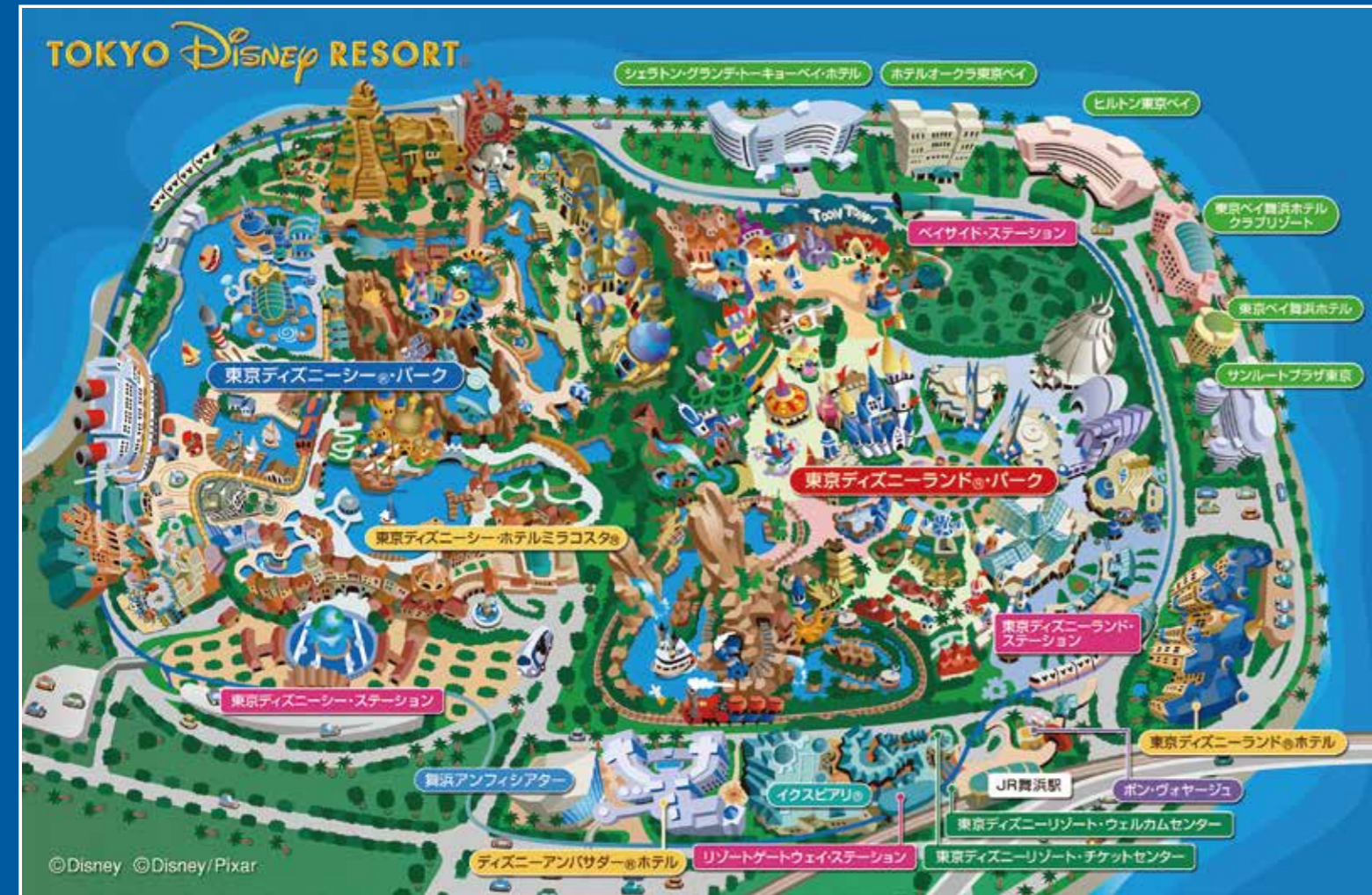
▲東京ディズニーリゾート。マップ 2017年10月11日時点

東京ディズニーリゾート内施設およびパーク内のアトラクションやエンターテイメント、その他の施設が予告なく休止、または運営時間などが変更となる場合があります。つきましては、事前に東京ディズニーリゾート・オフィシャルウェブサイト(www.tokyodisneyresort.jp)をご確認ください。